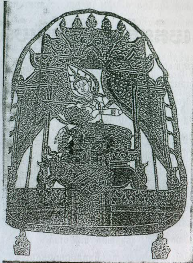
ស្បែកធំ (មកស្រង់ចេញពីសៀវភៅ ទស្សនិយភាពខ្មែរ ទំព័រ ៧១)

ជាដំបូង គេយកស្បែកស្រស់ដែលព្រលាត់ពីគោមកធ្វើភ្លាម ឬក៏ខ្ទប់ផេះទុកមួយរយៈ ការពារកុំឱ្យស្អុយនៅពេលគ្មានថ្ងៃហាល ។ ពេលធ្វើទើបគេរលាស់ផេះចេញ ហើយគ្រដាងកោសសាច់រៀវ សរសៃចេញឱ្យស្អាត ។ បន្ទាប់មកគេយកទៅគ្រាំទឹកសំបកឈើ ក្នុងរយៈពេលមួយយប់មួយថ្ងៃ ។ សំបកឈើអស់ទាំងនោះ សុទ្ធតែមានរសល្វីងខ្លាំងនិងចត់ខ្លាំង គឺដើម្បីការពារសត្វល្អិតចោះស៊ី ។ ជាបន្តគេស្រង់យកទៅហាលថ្ងៃ ដោយលាតសន្ធឹងលើផ្ទៃដីរាបស្មើ ហើយបោះស្នឹងទាញបន្តឹងយ៉ាងម៉ត់ចត់ ។ ក្រោយពេលស្ងួត គេយកមកកោសរាមបង្កើរឱ្យស្មើសាច់ ព្រោះកន្លែងខ្លះស្នឹងកន្លែងខ្លះក្រាស់ ។ ពេលឃើញថាសាច់ស្បែកស្អាតហើយ វិចិត្រករត្រូវប