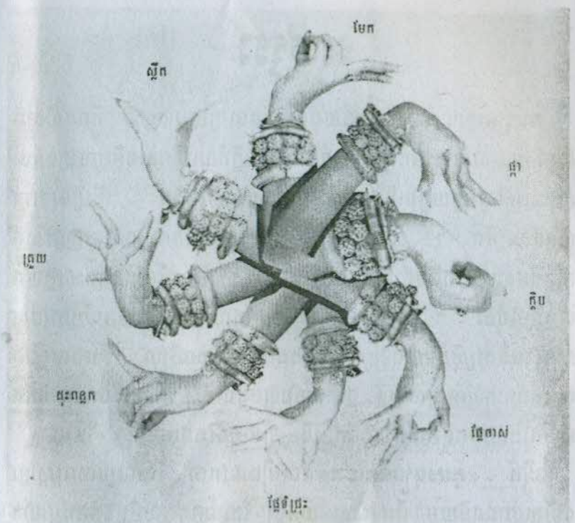
(រូបភាពដកស្រង់ពីសៀវភៅ "របាំខ្មែរ"របស់អ្នកនិពន្ធ ពេជ្រឌុំក្រវិល) កន្ទែកជើង ដោយឱនក្បាលបន្តិច រួចកាច់ដៃហើយយកកាំភ្លន់ដៃចាំងមុខ ដែរ ។

តួយក្សយំ គេនៅតែដំណាងឱ្យលក្ខណៈកាច ខ្លាំងដដែល គឺគេឈរ