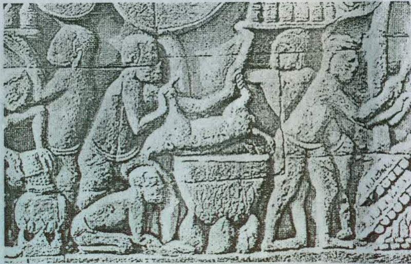
ទិដ្ឋភាពចំអិនដូប

ចម្លាក់នៅប្រាសាទបាយ័ន មានលក្ខណៈជាប្រជារាស្ត្រក្នុងទស្សនៈ លោកីយ៍ ។ លើផ្ទាំងចម្លាក់ទាំងអស់នេះ បានបង្ហាញពីភាពល្អឆើត ទាក់