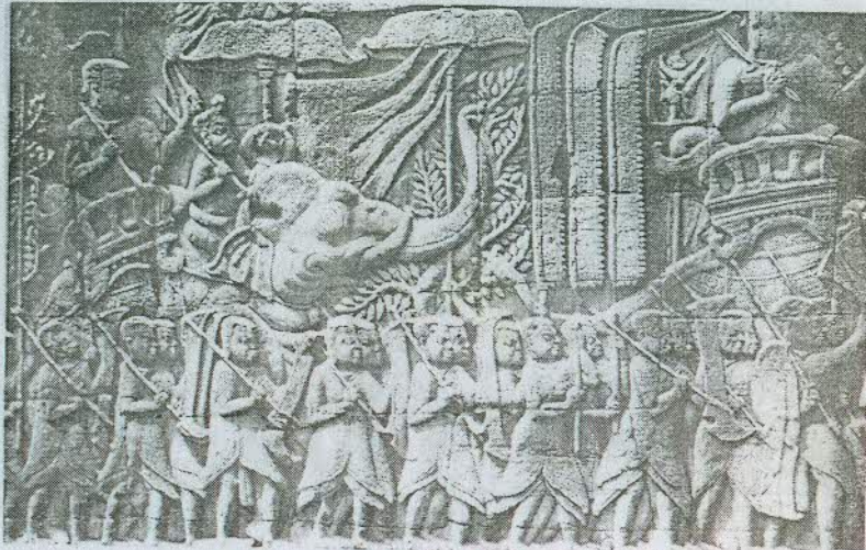
មេទ័ពខ្មែរចេញទៅច្បាំង ចំណាត់ប្រាសាទបាយ័ន

ថែវខាងក្រៅនិយាយពីរឿងរ៉ាវនិងប្រវត្តិសាស្ត្រ ។ ឯផ្នែកខាងក្នុង និយាយពីអទិទេព ទេវកថា ទស្សនៈចំបងនៃជំនឿទៅលើពុទ្ធសាសនា ។ ចម្លាក់នៅថែវខាងក្នុង ភាគច្រើនជារឿងរបស់ពួកប្រាហ្មណ៍ តាបស និង