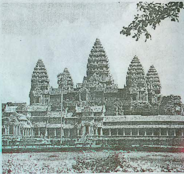
ប្រាសាទអង្គរវត្ត មើលពីជ្រុងលិចឆៀងខាងត្បូង

ទាញចិត្តទៅលើរឿងទេវកថាដ៏អស្ចារ្យ ។ ការដើរមើលប្រាសាទនេះ ត្រូវមើលពីឆ្វេងទៅស្តាំ ។ ម៉្យាងទៀតគេត្រូវមើលពេលព្រឹកនិងពេលល្ងាច ព្រោះមើលពេលថ្ងៃ ដុំថ្មអាចចាំងស្រវាំងភ្នែក ។ វេលាព្រះអាទិត្យទៀបអស្ចង្កត ពន្លឺក្រហមប្រាលឆ្ពោះចោលមកលើប្រាសាទ ងើបមើលទៅលើពពករសាត់លឿនលយ ដោយហោជាងមានក្បាច់រស់រវើក ។ អ្នកមើលកោតស្ងប់ស្ងួងព្រិខ្លួន អណ្តែតអណ្តូង... ។ ពេលមើលពីចម្ងាយ យើងឃើញប្រាសាទនេះតូចច្រឡឹង តែបើចូលទៅកាន់តែជិតឡើងៗនោះ បែរជាមានភាពសំបើមអស្ចារ្យ ។ នេះក៏ដោយសារទំហំនិងកំពស់មានលក្ខណៈ