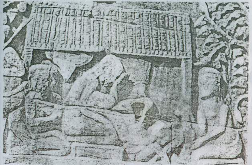
ទិដ្ឋភាពសំរាលកូនដោយមានធូប

ប្រាសាទបាយ័នជាប្រាសាទមួយដ៏ធំ បង្ហាញដោយប្រាង្គបីទទឹងគ្នា ប្រៀបដូចតួប្រាង្គនៅអង្គរវត្ត (មើលចំពីមុខ) ។ នៅចុងកំពូលនៃប្រាង្គ នីមួយៗមានលំអដោយត្រីសូលី ។ ការមើលប្រាសាទនេះ បានធ្វើចិត្តអ្នក ទស្សនាឱ្យសប្បាយស្ងប់ដោយសាររូបព្រហ្មធ្មេចភ្នែក តែបបួរមាត់ញញឹម។