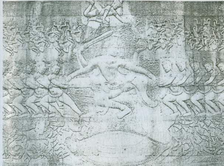
ចំណាក់រឿង "កូរសមុទ្រទឹកដោះ" នៅជញ្ជាំងប្រាសាទអង្គរវត្ត ខាងកើតច្រើនខាងក្នុង

រឿង «កុរសមុទ្រទឹកដោះ» គឺជារឿងទេវកថា ដែលប្រជារាស្ត្រខ្មែរ សម័យបុរាណនិយម ពិសេសសម័យអង្គរ ដែលអាចចូលចិត្តជក់អារម្មណ៍។ តឹកតាង យើងបានឃើញបុព្វបុរសខ្មែរបានបន្ទូលទុកនូវចម្លាក់ដ៏ល្អប្រណិត ជាច្រើននៅតាមប្រាសាទនានា ដែលទាក់ទងនឹងប្រធានបទនេះ ។ ក្នុង នេះមានរូបចម្លាក់ដ៏ល្អវិសេសមួយ គឺនៅប្រាសាទអង្គរវត្តថែវខាងកើត មាន បណ្តោយប្រវែង៤៩ម៉ែត្រនិងកំពស់២ម៉ែត្រ ។ ក្នុងនោះគេឃើញមាននាង អប្សរាដ៏ច្រើន កំពុងរាំនៅផ្នែកខាងលើ ។ ម្យ៉ាងទៀត យើងក៏តែងមាន ការចាប់អារម្មណ៍យ៉ាងខ្លាំងដែរ ពីចម្លាក់រូបនាងអប្សរារាប់ពាន់ដែលបាន ធ្លាក់នៅប្រាសាទអង្គរវត្ត សង្កែងនូវកាយវិការប្លែកខុសគ្នាទាំងអស់ ។ ចំណែកនៅប្រាសាទដទៃទៀតនោះ ថ្វីត្បិតតែមិនមានធ្លាក់នាងអប្សរាដ៏ច្រើន