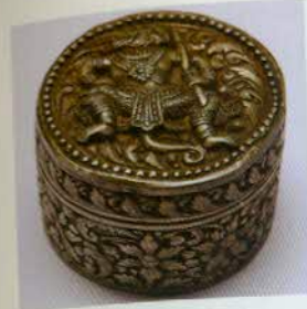
រូបលេខ៣១៖ ប្រអប់មាន ចម្លាក់តួអង្គក្នុងរឿងរាមកេរ្តិ៍។