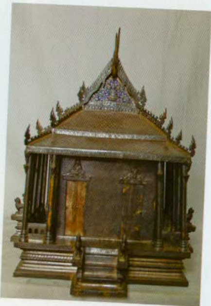
រូបលេខ៥៤៖ រូបព្រះវិហារប្រាក់តាំងនៅ សារមន្ទីរជាតិ ភ្នំពេញ។