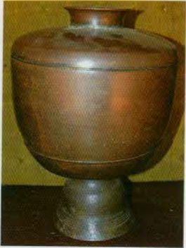
រូបលេខ៨៖ ផ្កិតខាត់។

ខេត្តកណ្តាល ២០ ។ ក៏ប៉ុន្តែ នៅកោះចិនក៏មានធ្វើផ្កិតស្ពាន់ដែរ តែមានលក្ខណៈ ប្រណីតជាង និងមានក្បាច់ក្បូរផង (រូបលេខ១០)។ ជាទូទៅ តំបន់នេះគេធ្វើ គ្រឿងប្រាក់។ រូបលេខ១១ដល់រូបលេខ១៤ ជាឧទាហរណ៍នៃគ្រឿងប្រាក់ដែល មានប្រើដល់បច្ចុប្បន្ន។