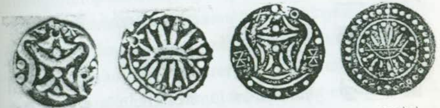
រូបលេខ៦៥ រូបលេខ៦៦ រូបលេខ៦៧ រូបលេខ៦៨

សំណង់បុរាណនិងបុរាណវត្ថុមួយចំនួន។ វត្ថុក្នុងចំណោមនោះ ខ្លះមានប្រភព មកពីចិន ឥណ្ឌា ពិភពអារ៉ាប់ និងចក្រភពរ៉ូម៉ាំង។ តែអ្វីដែលគួរឲ្យចាប់អារម្មណ៍ សម្រាប់ករណីសិក្សានេះ គឺវត្ថុធ្វើពីមាសនិងប្រាក់។ គេប្រទះឃើញមេដាយមាស និងកាក់រ៉ូម៉ាំងមួយចំនួនដែលមានរូបអធិរាជ Antonio Pius។ ក្រៅពីនេះ គេឃើញ មានកាក់ច្រើនប្រភេទផ្សេងទៀតដែលមានត្រាផ្សេងៗ និងមានអក្សរទេពនាគរី (រូបលេខ៦៥-៦៨)។ កំណាយនៅអង្គរវបុរីក្នុងខេត្តតាកែវ ដែលជាក្រុងមួយក្នុង សម័យកាលជាមួយគ្នានឹងអូកែវ ហើយដែលនៅមិនឆ្ងាយពីអូកែវនិងទំនាក់ទំនង គ្នាយ៉ាងសំខាន់តាមព្រែកដែលគេដឹកភ្ជាប់ពីសមុទ្រមកដែនដីខាងក្នុង គេក៏ប្រទះ ឃើញកាក់ប្រាក់ និងអលង្ការប្រភេទដូចគ្នាខ្លះ (រូបលេខ៦៩)។ កសិករទាំងនេះ បញ្ជាក់ថាយ៉ាងហោចណាស់អាណាចក្រហ្វូណានបានស្គាល់ប្រព័ន្ធពាណិជ្ជកម្ម ទ្រង់ទ្រាយធំរួចមកហើយ។ ទន្ទឹមនឹងនេះ គេស្គាល់យ៉ាងប្រាកដថាអ្វីជារូបិយវត្ថុ ដែលគេប្រើសម្រាប់ទូទាត់ទំនិញរួចមកហើយ ទោះបីជាយើងពុំដឹងថាអាណា ចក្រហ្វូណានមាន ឬពុំទាន់មានរូបិយវត្ថុរបស់ខ្លួនក្តី។