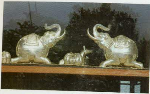
រូបលេខ២០៖ ប្រអប់រូបដំរី។