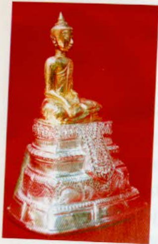
រូបលេខ៥០៖ បល្ល័ង្កប្រាក់និង ព្រះពុទ្ធរូបស្រោបមាស។