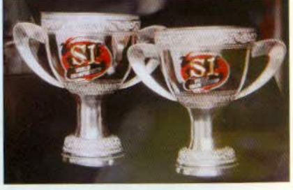
រូបលេខ៦៣៖ ពានរង្វាន់ធ្វើពីស្ពាន់ជ្រលក់ប្រាក់។