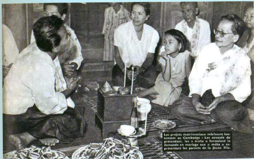
Les projets matrimoniaux mûrissent lentement au Cambodge : Les envoyés du prétendant, les « moha » formulent la demande en mariage aux « maba » représentant les parents de la jeune fille.