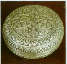
រូបលេខ៣០៖ ជន្លាប។