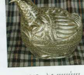
រូបលេខ៣៦៖ ប្រអប់រូប សត្វក្រូច។