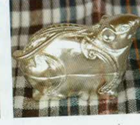
រូបលេខ៣៥៖ ប្រអប់រូប កណ្តុរ។