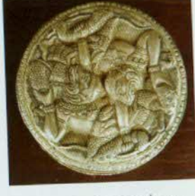
រូបលេខ៣២៖ ប្រអប់មាន ចម្លាក់តួអង្គក្នុងរឿងរាមកេរ្តិ៍។