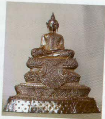
រូបលេខ៥១៖ បល្ល័ង្កនិងព្រះពុទ្ធ រូបធ្វើពីប្រាក់។