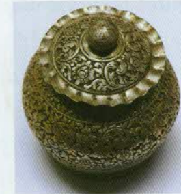
រូបលេខ១៨