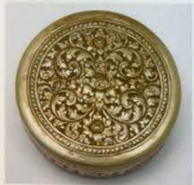
រូបលេខ២៨៖ ប្រអប់មូល។