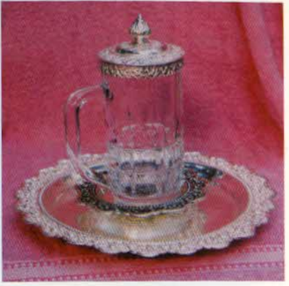
រូបលេខ៦១៖ កែវទឹកស្រោបប្រាក់។