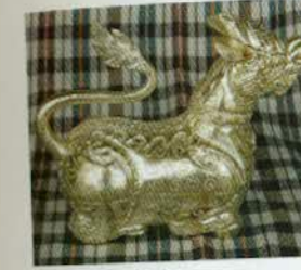
រូបលេខ៣៤៖ ប្រអប់រូប រាជសីហ៍។