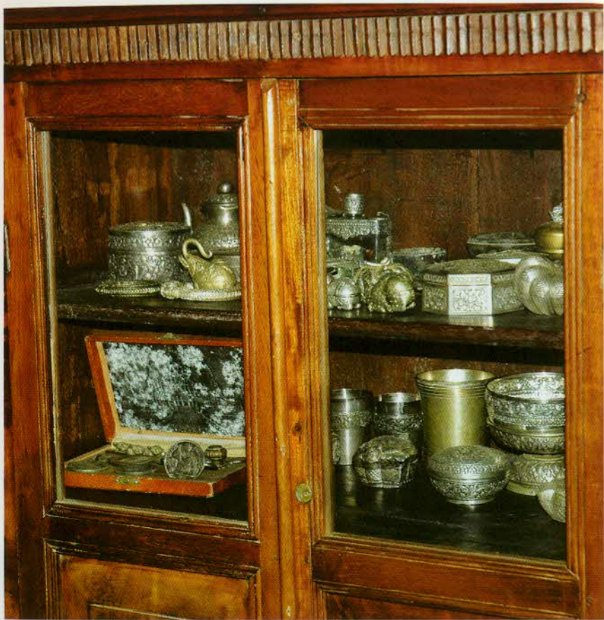
រូបលេខ៧៖ គ្រឿងប្រាក់ដែលគេរក្សានៅតាមផ្ទះ (សម្តីយងឯកជន)។

យើងអាចបែងចែកគ្រឿងទាំងនេះជាពីរប្រភេទធំៗជាបន្តទៀត៖ ប្រភេទទី១ ជាគ្រឿងប្រាក់បែបប្រពៃណី ដែលគេមានតាំងពីបុរាណតរៀងមក មានដូចជាផ្តិល ខាល ទៀប ពាន តុ ថាស គ្រឿងហិបស្វាល។ ប្រភេទទី២ ជាគ្រឿងប្រាក់ដែលគេច្នៃឱ្យតាមលំនាំវត្តមានប្រើនៅអីរុប ឬច្នៃបង្កើតឱ្យតាមសម័យកាល មានដូចជាសម ស្លាបព្រា វែក ប្រអប់បារីស៊ីហ្គារ ស្រោមដែកកេស ធុងទឹកកក។ល។ វត្ថុទាំងនេះ គេធ្វើឡើងក្រោយសម័យបារាំង ហើយសម្រាប់បំពេញតម្រូវការរបស់បារាំងនិងអភិជនខ្មែរនាពេលនោះ។