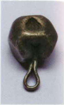
រូបលេខ៦២៖ ប្រាក់ខ្នងដែលម្ចាស់ យកមកផ្សាច្នៃជាត្រវិលពាក់។

(រូបលេខ៦២)។ ក្រោយមកទើបមានរូបិយប័ណ្ណធ្វើពី ក្រដាសចេញមុខជំនួសកាក់ធ្វើពីលោហធាតុទាំងនោះ។ ទោះបីប្រាក់លែងជារូបធាតុសំខាន់សម្រាប់ការផលិតក្តី កាសាមួយចំនួនលើពិភពលោក ក្នុងនោះមានកាសាខ្មែរ ផងក៏នៅតែហៅថា “ក្រដាសប្រាក់” ដដែល។