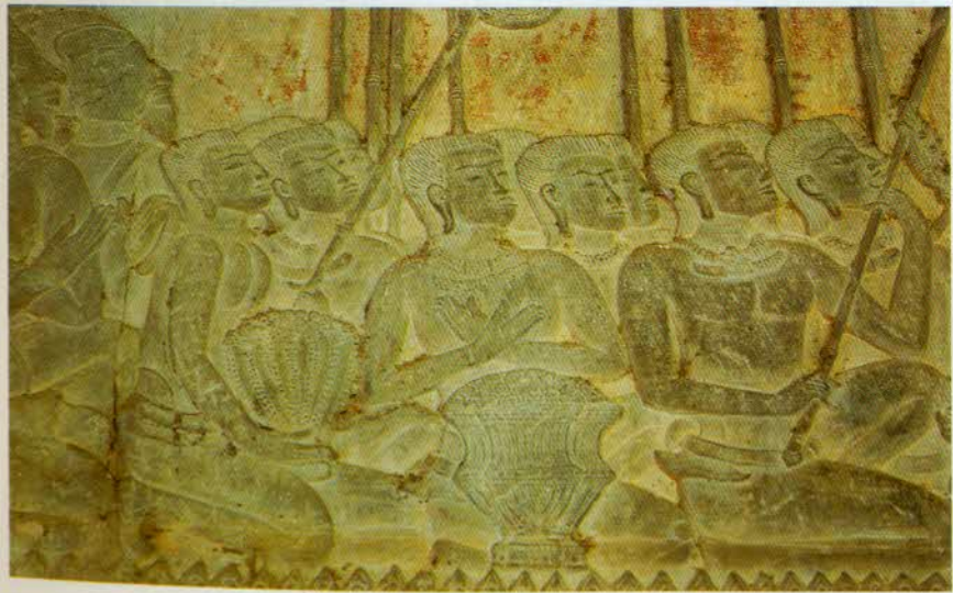
រូបលេខ១៖ ជើងពាន (?) ឃើញមានតាមចម្លាក់នៅអង្គរវត្ត (សតវត្សទី១២)។