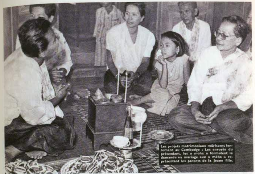
Les projets matrimoniaux mûrissent lentement au Cambodge : Les envoyés du prétendant, les « méba » formalisent la demande en mariage aux « méba » représentant les parents de la jeune fille.