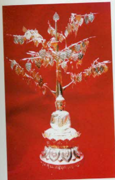
រូបលេខ២៧៖ ព្រះពុទ្ធរូប និងដើម ពោធិមាសនិងប្រាក់។

គ្រឿងប្រើក្នុងកិច្ចពិធីដែលយើងឃើញស្គាល់គ្រប់គ្នា ជាពិសេសគ្រឿង ប្រើក្នុងពិធីមង្គលការ។ សព្វថ្ងៃគ្រឿងរណ្តាប់ក្នុងមង្គលការទាំងនេះ គេធ្វើពីស្ពាន់ ឬទង់ដែលជ្រលក់ប្រាក់ ជូនកាលរហូតដល់ពណ៌មាសទៀតផង ដោយសារសព្វ ថ្ងៃការជ្រលក់ពណ៌មាសឬប្រាក់នេះងាយ។ គ្រឿងរណ្តាប់ដែលមានសក្តារៈខ្លាំង គេអាចធ្វើពីប្រាក់ឬរហូតដល់មាសផង។ អ្នកដែលមានទ្រព្យសម្បត្តិ ហើយមាន សាទ្ធាជ្រះថ្លាក្នុងសាសនា ឬក្នុងជំនឿណាមួយក៏តែងធ្វើគ្រឿងរណ្តាប់របៀបនេះ ជាតម្លាយដល់ប្រាសាទ វត្តអារាម និងទីតម្កល់ព្រះពុទ្ធរូបតាមផ្ទះ (រូបលេខ២៧- ២៨)។ សិលាចារឹក K. 754 ដែលចារនៅសតវត្សទី១២ និយាយពីស្បូវភ្នាំងធ្វើពី ប្រាក់ដែលគេធ្វើជាគ្រឿងរណ្តាប់ថ្វាយដល់ប្រាសាទ ៣០ ។ គេយកប្រាក់ចារយ័ន្ត្រ ធ្វើខ្សែតាថា និងធ្លាក់ធ្វើគម្របក្រាំង គម្ពីរ សាស្ត្រាស្លឹកវិទ្យាល្យ។