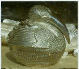
រូបលេខ២៦៖ ប្រអប់រូបសត្វស្វាប។