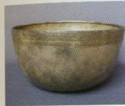
រូបលេខ១៥

រូបលេខ១២-១៥៖ គ្រឿងប្រាក់ខ្លះៗដែលមាន ដល់សព្វថ្ងៃ (រូបថតលេខ១៥ ជារបស់សារមន្ទីរជាតិ ភ្នំពេញ)។