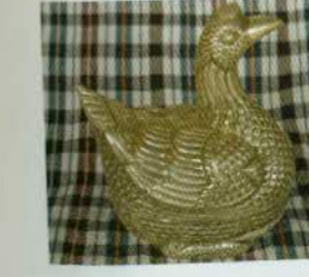
រូបលេខ៣៧៖ ប្រអប់រូបទា។