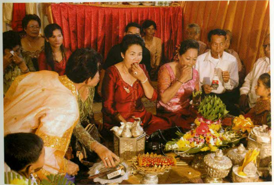
រូបលេខ២៤៖ ស៊ីស្វាក្នុងមង្គលការ។