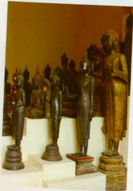
រូបលេខ៥៣៖ ព្រះពុទ្ធរូបប្រាក់តាំងនៅ សារមន្ទីរជាតិភ្នំពេញ។