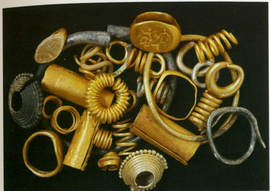
រូបលេខ២៖ អលង្ការមាសនិងប្រាក់ដែលគេប្រទះឃើញក្នុងកំណាយនៅស្ថានីយ៍ព្រហារខេត្តព្រៃវែង (រូបថតដោយ Andrea Reinecke)។

ប្រាក់មានតម្លៃបន្ទាប់ពីមាស ដោយសារប្រាក់មិនរងប៉ះពាល់នឹងអាស៊ីតក្នុងបរិយាកាស និងទង់ស្លឹក ដែលគេអាចពត់ឬដំបានតាមចិត្តចង់។ មនុស្សចេះយកប្រាក់ធ្វើជាអលង្ការ និងដើម្បីតុបតែងលម្អរាប់ពាន់ឆ្នាំមកហើយ។ នៅកម្ពុជា យើងប្រទះឃើញគ្រឿងអលង្ការប្រាក់យ៉ាងហោចណាស់ប្រមាណ៥០០ឆ្នាំមុនគ.ស.មកម៉្លោះ។ កំណាយនៅស្ថានីយ៍បុរេប្រវត្តិ និងក្រោយបុរេប្រវត្តិសាស្ត្រមួយ