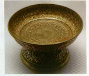
រូបលេខ១៤