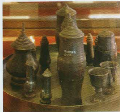
រូបលេខ២១៖ គ្រឿងហិបស្វាធ្វើពីស្ពាន់។