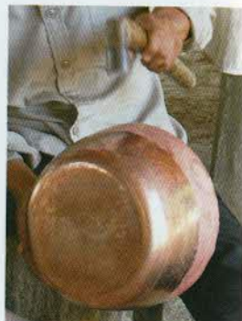
រូបលេខ១០៖ ធ្វើផ្កិតស្ពាន់។