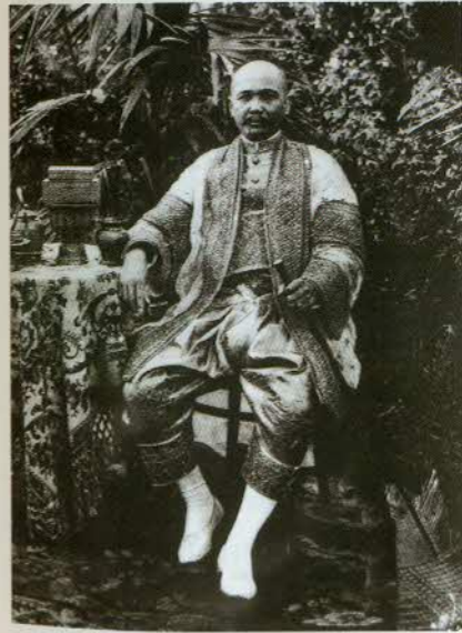
រូបលេខ៥៖ គ្រឿងប្រាក់ដែលមាននៅតាម ផ្ទះអភិជននៅដើមសតវត្សទី២០ (រូបថត៖ រោងជាងជួសជុលចម្លាក់ថ្មនៃសារមន្ទីរជាតិ ភ្នំពេញ)។

ជាទូទៅ គេទុកដាក់គ្រឿងប្រណីតាដែលមានតម្លៃដូចជាគ្រឿងប្រាក់នៅ កន្លែងទីទៃពីបានក្បានដែលធ្វើពីដីដុត ឬលោហធាតុមិនសូវមានតម្លៃផ្សេងទៀត។ បាន ស្លាបព្រា... ដែលធ្វើពីដីដុតឬលោហធាតុធម្មតា គេទុកក្នុងរាវដែលតែងតែ នៅចង្រ្កានបាយ រីឯគ្រឿងប្រាក់ គេរក្សាក្នុងទូកញ្ជក់ត្រឹមត្រូវ ហើយច្រើនតែ ឃើញនៅល្វែងធំ ជាកន្លែងទទួលភ្ញៀវ ដែលគេហៅជាទូទៅថា “ទូតាំង” ដូច្នោះតែ ម្តង ត្បិតគេប្រើសម្រាប់រក្សាទុកផង តាំងបង្ហាញផង (រូបលេខ៧)។ របស់ទាំងនេះ គេបញ្ចេញមកប្រើប្រាស់ម្តងម្កាលពេលមានភ្ញៀវពន្លឺឬបុណ្យទានប៉ុណ្ណោះ។