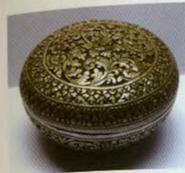
រូបលេខ១២