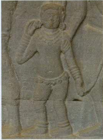
រូបលេខ៣៖ កុមារពាក់គ្រឿងអលង្ការ (ចម្លាក់នៅអង្គរវត្ត)។

ប្រាសាទជំរាមួយចំនួន ដូចជាអង្គរវត្ត បាយ័ន បន្ទាយច្បារ។ល។ យើងឃើញថា ជាទូទៅ គូអង្គរីមួយៗតែងមានតុបតែងខ្លួនដោយ គ្រឿងអលង្ការយ៉ាងស្តុកស្តម្ភរហូតដល់រូប កូនក្មេងទៀតផង (រូបលេខ៣)។ ឧទាហរណ៍ របៀបនេះឃើញថាមានច្រើនណាស់ មិន ចាំបាច់នឹងលើកមកនិយាយវែងឆ្ងាយទេ។ សព្វថ្ងៃ ទោះបីមនុស្សនិយមអលង្ការមាស ជាងក្តី ក៏យើងនៅឃើញមានអ្នកខ្លះធ្វើពី ប្រាក់ដែរ ជាពិសេសគេនិយមធ្វើជាកងដែ (រូបលេខ៤) ខ្សែក។