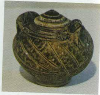
រូបលេខ២១៖ អកកំបោរធ្វើពីដីដុត។

ប្រអប់ម្លូស្នាធ្វើពីមាស ឬប្រាក់ដែលត្រូវយកតាមខ្លួននេះ គឺក្លាយជា គ្រឿងសម្គាល់យសសក្តិ និងអំណាចទៀតផង។ ឆ្នាំដំបូងក្នុងខ្លះដែលបង្ហាញពីទី សវនាការណាមួយ ឬក្នុងអាស្រមនៃព្រាហ្មណ៍ធំៗ គេឃើញមានកាដន៍ដែល មើលទៅសមជាគ្រឿងពានសម្រាប់ដាក់ម្លូស្នា (រូបលេខ២២-២៥) ហើយដែល នៅក្នុងរំងឺគេហៅថា “ពានព្រះស្រី”។ ក្រោយមកគ្រឿងហិបស្នាជាគ្រឿងតំណាង យសសក្តិដែលត្រូវមានជាប់ខ្លួន ដូចជាកេតនក៏ណែនមន្ត្រីធំៗទៀតផង។ ទោះបី ជាអ្នកប្រវត្តិសាស្ត្ររៀបរាប់ថា ពេលឡើងសោយរាជ្យ ព្រះបាទអង្គខ្នងមាន