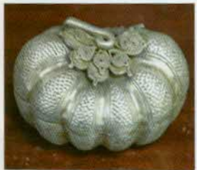
រូបលេខ២៥៖ ប្រអប់រូបផ្លែឈ្លូ។

ធ្វើដោយជាងចំណាន។ ឯព្រះមហាក្សត្រនិងមជ្ឈដ្ឋានក៏ដឹង គេប្រើរបស់ដូចគ្នា តែធ្វើពីមាស។ ប្រអប់តូចៗ ដែលដាក់ក្នុងហិបមានរូបរាងផ្សេងគ្នា តែគេនិយម ធ្វើជារូបសត្វ ផ្ទៃឈើ បើសាមញ្ញមានរាងមូល ឬជ្រុង តែប្រអប់នីមួយៗមានក្បូរ ក្បាច់ភ្លឺទេស (រូបលេខ២៥-៣០) ជួនកាលទៀតគេធ្លាក់ជាតួអង្គផ្សេងៗក្នុងរឿង រាមកេរ្តិ៍ទៀតផង (រូបលេខ៣១-៣៣)។ បើជារូបសត្វ គេច្រើនធ្វើសត្វទាំង១២នៃ ឆ្នាំកំណើតរបស់មនុស្ស។ ជួនកាលគេធ្វើជារូបសត្វក្នុងទេវកថា ដូចជារាជសីហ៍ (រូបលេខ៣៤) គណសីហ៍។ ក្រៅពីសត្វតំណាងឆ្នាំទាំង១២ មានសត្វផ្សេងៗទៀត ដែលនៅជិតស្និទ្ធនឹងជីវិតប្រចាំថ្ងៃរបស់គេ ដូចជាកង្កែប ត្រី រហូតដល់សត្វដំមាន ក្តាន់ រមាំង ដីរីជាដើម (រូបលេខ៣៥-៤០)។ សត្វដីគេនិយមជាខ្លាំង ត្បិតគេជឿថា ដីរីជាសត្វមានអំណាចហើយស្នូតបូតនិងត្រដាក់ត្រដុំ។ រូបរាងប្រអប់នេះធ្វើឲ្យ យើងគិតថយក្រោយទៅដល់សម័យអង្គរ។ នៅសម័យអង្គរគេនិយមផលិតកាជន៍ តូចៗ ជាប្រអប់ឬខូចជារូបរាងសត្វផ្សេងៗរបៀបនេះដែរ (រូបលេខ៤១)។ កាជន៍