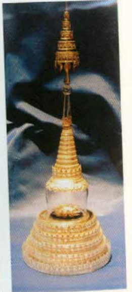
រូបលេខ២៩៖ ពេតិយកែវ ស្រោបបាក់ជ្រលក់មាស។