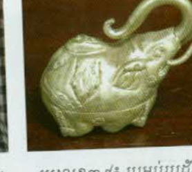
រូបលេខ៣៩៖ ប្រអប់រូបដំរី។

ខ្លះ គេវិភាគមើលទៅឃើញថានៅមានជាប់កំបោរនៅផ្ទៃខាងក្នុង នាំឲ្យគេសន្និដ្ឋាន ថាពីមុនមកគេប្រើជាអកកំបោរ។ តើកតាងទាំងនេះអាចឲ្យគេសន្និដ្ឋានថា យ៉ាង ហោចណាស់ទំនៀមនៃការផលិតប្រអប់ប្រាក់រូបសត្វ ឬផ្ទៃឈើដែលយើងឃើញ សព្វថ្ងៃនៅតំបន់កំពង់ហ្លួង មានដើមកំណើតតាំងពីពេលនោះមក។