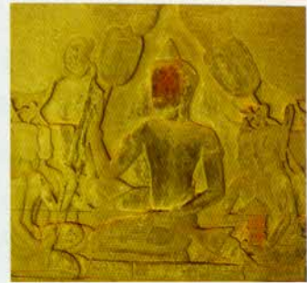
រូបលេខ២៥

សេចក្តីខ្លាញ់ខ្លាំងខ្លាំងពីលទ្ធភាពដែលរៀបចំនគរខ្មែរឡើងវិញ ដោយសារស្រុក ធ្លាក់ជុនជាបក្រខ្យត់ខ្លាំង តែពេលនោះក៏គេនៅតែចាត់ទុកគ្រឿងប្រាក់ថាសំខាន់ ជាកិត្តិយស។ ក្រោយឡើងសោយរាជ្យសម្បត្តិ ព្រះបាទអង្គខ្នងប្រកាសអនុញ្ញាត ឲ្យភិយាមន្ត្រីធំៗមានគ្រឿងប្រអប់ស្នាតាមខ្លួនដូចថ្មីដែរ ពេលចូលរំងឺគាល់ស្តេច ឬក្នុងសវនាការផ្សេងៗ ២៦ ។