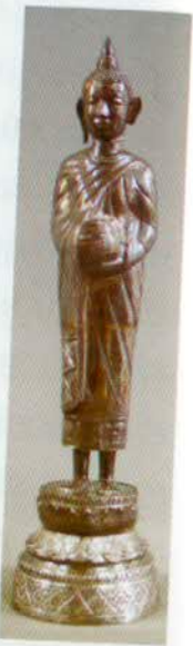
រូបលេខ៥២៖ ព្រះពុទ្ធច្រង់បាត្រ។