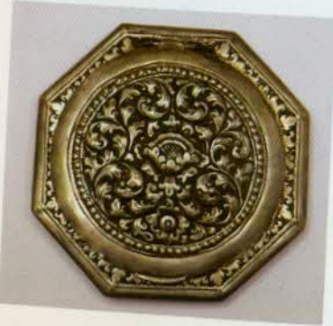
រូបលេខ៥៧៖ ប្រអប់ ម្សៅ។