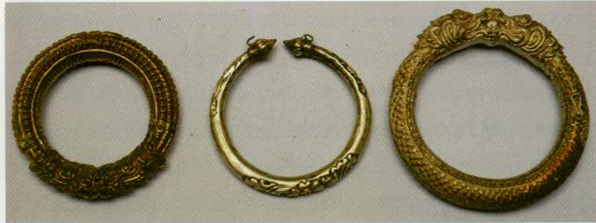
រូបលេខ៤៖ កងដែបច្ចុប្បន្នធ្វើពីប្រាក់ (សម្បូរយំឯកជន)។