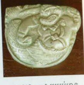
រូបលេខ៣៣៖ ប្រអប់មាន ចម្លាក់តួអង្គក្នុងរឿងរាមកេរ្តិ៍។