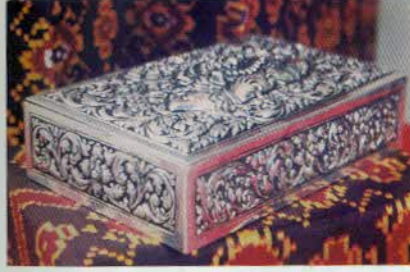
រូបលេខ៦២៖ ប្រអប់ដាក់នាមប័ណ្ណ។