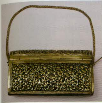
រូបលេខ៦០៖ កាបូបប្រាក់។