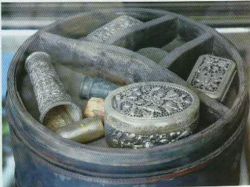
រូបលេខ២២៖ ហិបស្វាធ្វើពីឈើ និងប្រអប់ប្រាក់។