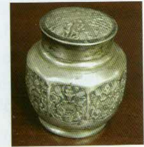
រូបលេខ១៩

ការផលិតគ្រឿងប្រាក់វិញ គេឃើញប្រមូលផ្តុំគ្នានៅភូមិមួយចំនួនក្បែរ អតីតរាជធានីឧត្តុង្គ ពោលគឺតំបន់កំពង់ហ្លួងនិងកោះចិន។ គ្រឿងប្រាក់ទាំងនោះ កាត់ច្រើនគេធ្វើតាមការបញ្ជាទិញពីអ្នកមានទ្រព្យសម្បត្តិនៅភ្នំពេញ។ ដោយសារ ប្រាក់ថ្លៃផង គេកម្រឃើញជាងប្រាក់មានវត្ថុធាតុដើមប្រាក់នៅតាមផ្ទះ ហើយ ផលិតជាគ្រឿងសម្រាប់ដាក់ទុកលក់ដូរដូចគ្រឿងស្ពាន់ឬដែកណាស់។ កាលណា គេត្រូវការគ្រឿងអ្វីមួយពីប្រាក់ អ្នកទាំងនោះមករកជាងដើម្បីស្នើឲ្យធ្វើ ដោយនាំ