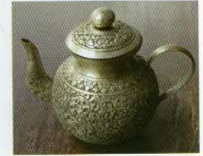
រូបលេខ១៦

រូបលេខ១២-១៥៖ គ្រឿងប្រាក់ខ្លះៗដែលមាន ដល់សព្វថ្ងៃ (រូបថតលេខ១៥ ជារបស់សារមន្ទីរជាតិ ភ្នំពេញ)។