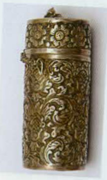
រូបលេខ៥៩៖ បំពង់ ដាក់កាបូហ៊ីត។