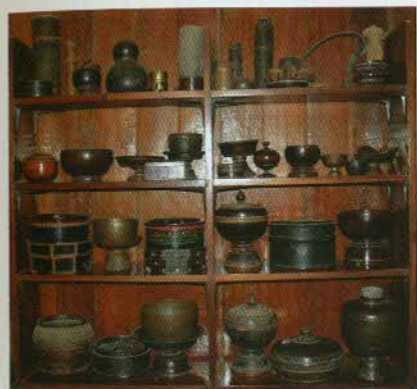
រូបលេខ២០៖ ហិបស្វានិងគ្រឿងផ្សេងៗ។

កន្លងមកមានការសិក្សាច្រើនទាក់ទងនឹងទំនៀមទទួលទានម្លូស្វានេះ។ បើចង់ដឹងវែងឆ្ងាយ អ្នកអានអាចរកមើលសំណេរអំពីរឿងនេះ ត្បិតយើងនឹងមិន ជជែកវែងឆ្ងាយនៅទីនេះទេ។ តែទោះបីយ៉ាងណា យើងមិនអាចជៀសមិន