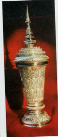
រូបលេខ២៨៖ កោដ្ឋប្រាក់ ជ្រលក់មាស។