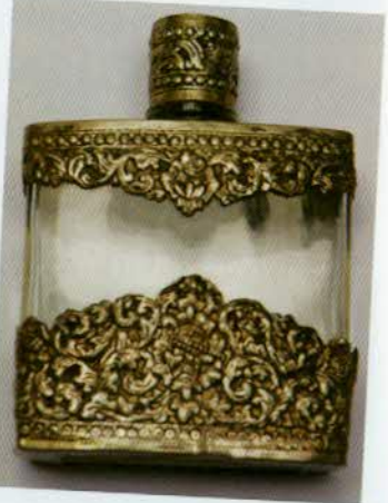
រូបលេខ៥៦៖ ដបទឹកអប់ស្រោបប្រាក់។