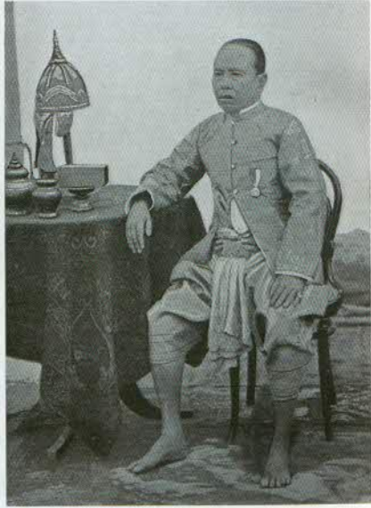
រូបលេខ៦៖ គ្រឿងប្រាក់ដែលមាននៅតាមផ្ទះ អភិជននៅដើមសតវត្សទី២០។