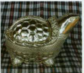
រូបលេខ២៧៖ រូបសត្វអណ្តើក។