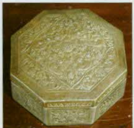
រូបលេខ២៩៖ ប្រអប់ប្រាំបីជ្រុង។