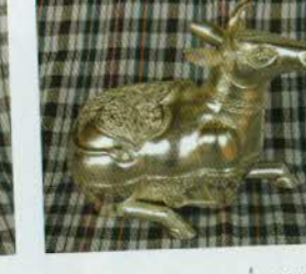
រូបលេខ៣៨៖ ប្រអប់រូបគោ។