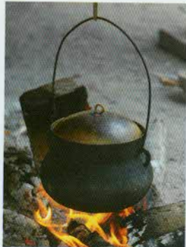
រូបលេខ៩៖ ឆ្នាំងខ្លាស់។