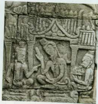
រូបលេខ២៣

រូបលេខ២២-២៥៖ កាដន៍ដែលមានរូបរាងដូចជើងពានប្រាក់សព្វថ្ងៃ (រូបលេខ២២-២៣ ចម្លាក់នៅ ប្រាសាទបាយ័ន្ត ឯរូបលេខ២២-២៥ ចម្លាក់នៅអង្គរវត្ត)។