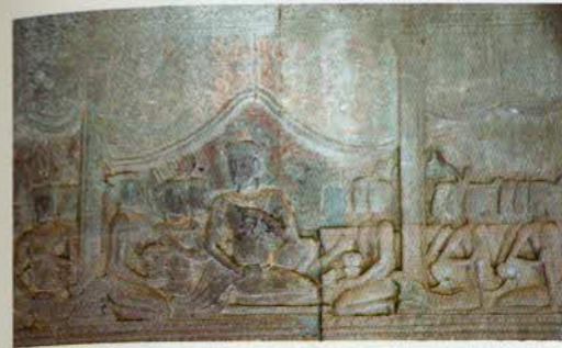
រូបលេខ២៤

រូបលេខ២២-២៥៖ កាដន៍ដែលមានរូបរាងដូចជើងពានប្រាក់សព្វថ្ងៃ (រូបលេខ២២-២៣ ចម្លាក់នៅ ប្រាសាទបាយ័ន្ត ឯរូបលេខ២២-២៥ ចម្លាក់នៅអង្គរវត្ត)។