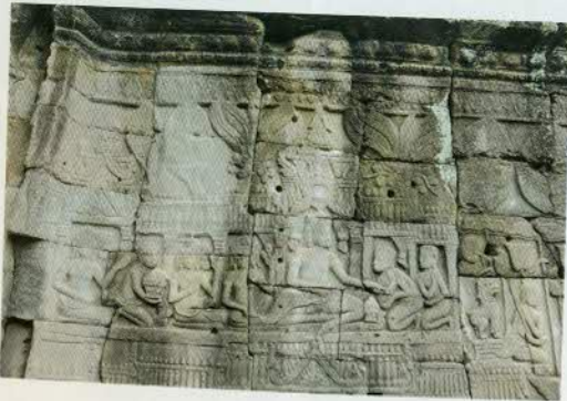
រូបលេខ២២

ប្រអប់ម្លូស្នាធ្វើពីមាស ឬប្រាក់ដែលត្រូវយកតាមខ្លួននេះ គឺក្លាយជា គ្រឿងសម្គាល់យសសក្តិ និងអំណាចទៀតផង។ ឆ្នាំដំបូងក្នុងខ្លះដែលបង្ហាញពីទី សវនាការណាមួយ ឬក្នុងអាស្រមនៃព្រាហ្មណ៍ធំៗ គេឃើញមានកាដន៍ដែល មើលទៅសមជាគ្រឿងពានសម្រាប់ដាក់ម្លូស្នា (រូបលេខ២២-២៥) ហើយដែល នៅក្នុងរំងឺគេហៅថា “ពានព្រះស្រី”។ ក្រោយមកគ្រឿងហិបស្នាជាគ្រឿងតំណាង យសសក្តិដែលត្រូវមានជាប់ខ្លួន ដូចជាកេតនក៏ណែនមន្ត្រីធំៗទៀតផង។ ទោះបី ជាអ្នកប្រវត្តិសាស្ត្ររៀបរាប់ថា ពេលឡើងសោយរាជ្យ ព្រះបាទអង្គខ្នងមាន