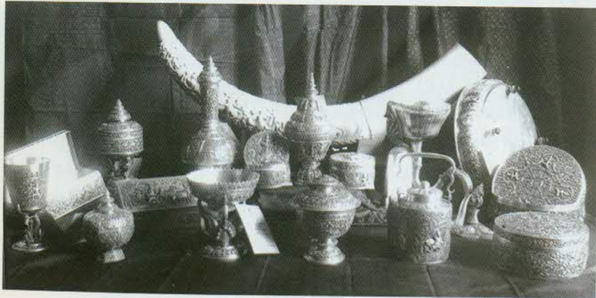
រូបលេខ១១៖ គ្រឿងប្រាក់ខ្លះៗនៅសម័យមុន។