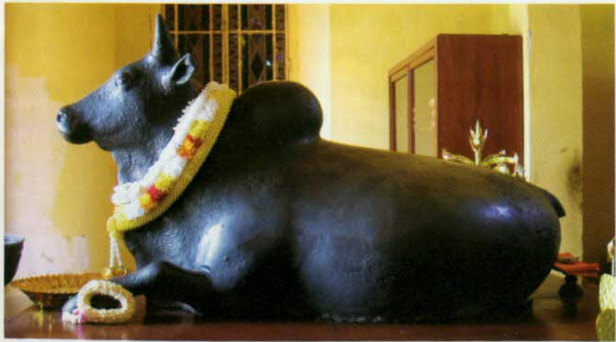
រូបលេខ២៦៖ រូបព្រះគោនខ្លីធ្វើពីប្រាក់ (រកឃើញឆ្នាំ១៩៨៣ នៅទួលគុហារ ស្រុកស្អាង ខេត្តកណ្តាល)។

នៅដើមឆ្នាំ១៩៨៣ គេធ្លាប់ប្រទះឃើញរូបព្រះគោនខ្លីមួយនៅទួល គុហារ (ស្រុកស្អាង ខេត្តកណ្តាល) ដែលគេសន្និដ្ឋានថាសាងនៅសតវត្សទី៧ (រូបលេខ២៦)។ រូបព្រះគោនខ្លីនេះសិតពីលោហធាតុ ដែលមានជាតិប្រាក់ប្រមាណ ជាង៧០ភាគរយ។ សព្វថ្ងៃរូបនេះតម្កល់នៅក្នុងហោព្រះត្រៃនៃព្រះបរមរាជវាំង។ សិលាចារឹកនៅក្រុមប្រាសាទសម្បូណ៍ព្រៃគុក (ខេត្តកំពង់ធំ) មានរៀបរាប់ថា គេ សាងរូបព្រះគោធ្វើអំពីប្រាក់ ២៧ ។ រូបព្រះគោនខ្លីដែលគេដឹងតាមសិលាចារឹកចារ នៅប្រាសាទសម្បូណ៍ព្រៃគុកនិយាយថាជារូបស្នងឲ្យក្រឹតយុគ ២៨ ។ បើយើងស្រង់ តែក្នុងសិលាចារឹកនៅប្រាសាទព្រះខ័ន ចារនៅគ.ស.១១៩១ រៀបរាប់ថា មាន បដិមាធ្វើពីមាសនិងប្រាក់ចំនួន២៣០ តម្កល់នៅប្រាសាទនេះ និងជាង២០០០ ទៀត នៅពាសពេញចក្រភពខ្មែរនាពេលនោះ ២៩ ។