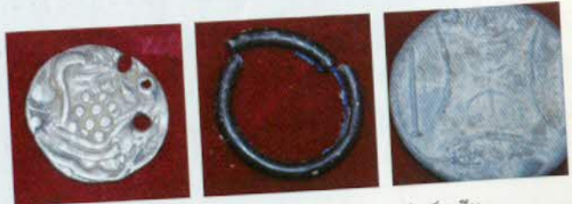
រូបលេខ៦៩៖ កាក់ប្រាក់ប្រទះឃើញនៅអង្គរវបុរី។

រូបលេខ៦៥-៦៨៖ ឧទាហរណ៍ខ្លះពីកាក់ប្រាក់ដែលប្រទះឃើញនៅអូកែវ។