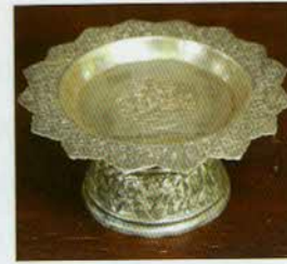
រូបលេខ១៣