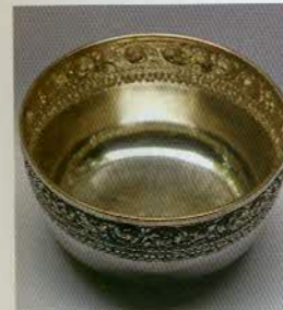
រូបលេខ១៧