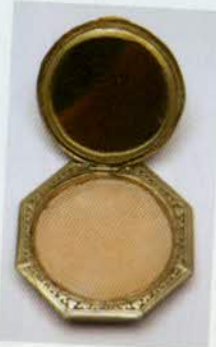
រូបលេខ៥៨៖ ប្រអប់ ម្សៅ។